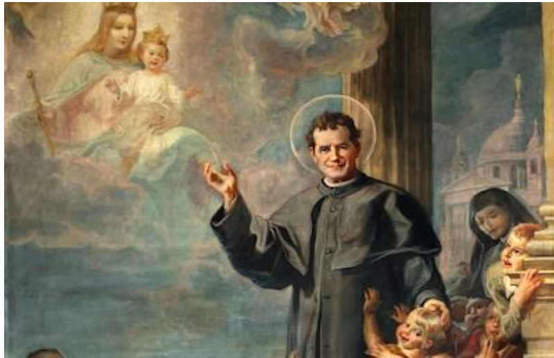
Hãy luôn chạy đến với Đức Mẹ Phù hộ